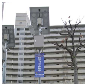
大阪市喜連東連合振興町会