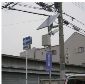
大阪市加美北連合町会