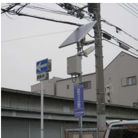
大阪市加美北連合町会