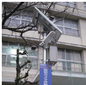
大阪市長吉六反連合町会